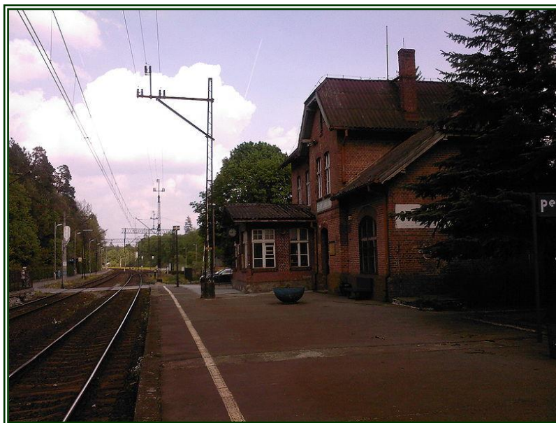
Fot. Stacja PKP w Starych Jabłonkach

Przez Stare Jabłonki przebiega linia kolejowa o znaczeniu pierwszorzędym, zelektryfikowana (w większości) relacji 353 Poznań Główny - Żeleznodorożnyj.