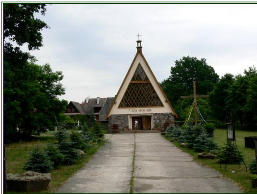
Fot. Kościół - Parafia św. Matki Boskiej Królowej Polski w Starych Jabłonkach