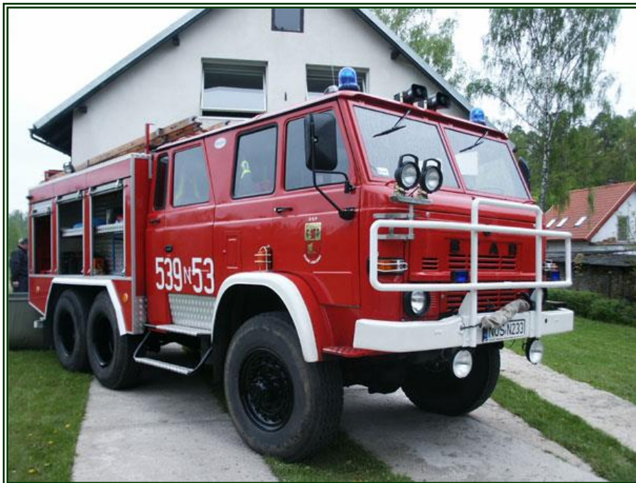
Fot. Wóz strażacki

Ze względu na usytuowanie obok drogi krajowej nr 16, Ochotnicza Straż Pożarna w Starych Jabłonkach została wpisana do Krajowego Sytemu Ratowniczo - Gaśniczego.