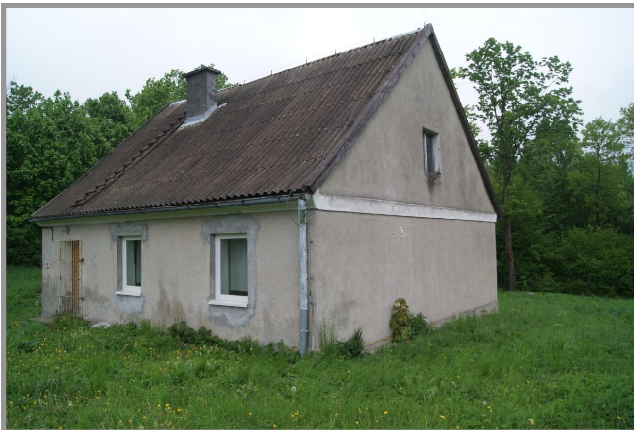
Fot. Budynek Świetlicy Wiejskiej w Wysokiej Wsi

Obszarem o szczególnym znaczeniu dla zaspokojenia potrzeb społecznych miejscowości Wysoka Wieś, mając na uwadze przede wszystkim układ przestrzenno-urbanistyczny, a także przeznaczenie obiektów zlokalizowanych w tym rejonie, jest obszar zawarty pomiędzy Hotelem SPA Dr Irena Eris Wzgórza Dylewskie, świetlicą wiejską a budynkiem Starej Szkoły. Walory i cechy przestrzenno-urbanistyczne przedmiotowego obszaru przemawiają za koniecznością jego rozwoju pod kątem efektywnego kształtowania tej przestrzeni publicznej, wprowadzania działań na rzecz podnoszenia stopnia rozwoju społeczeństwa, zacieśniania więzi i integrację społeczną.