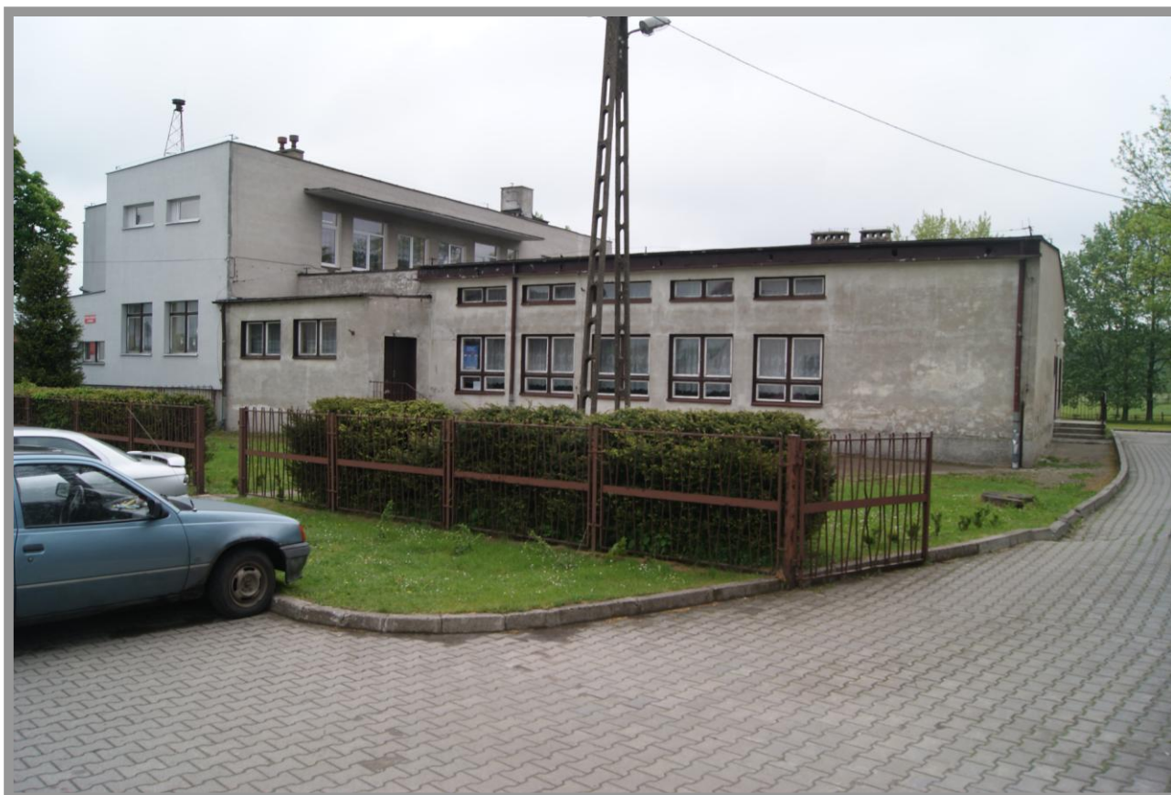
Fot. Budynek Świetlicy Wiejskiej w Pietrzwałdzie

Obszarem o szczególnym znaczeniu dla zaspokojenia potrzeb społecznych miejscowości Pietrzwałd, mając na uwadze przede wszystkim układ przestrzenno-urbanistyczny, a także przeznaczenie obiektów zlokalizowanych w tym rejonie, jest obszar, na którym znajdują się Przedszkole Samorządowe, Świetlica Wiejska, Remiza OSP, Koło Gospodyń Wiejskich oraz kościół. Koncentracja praktycznie w jednym miejscu ważnych dla życia społecznego instytucji i obiektów, sprawia że obszar ten pełni funkcję CENTRUM WSI rozumianego jako centrum społeczno-kulturalno-rekreacyjne. Walory i cechy przestrzenno-urbanistyczne przedmiotowego obszaru przemawiają za koniecznością jego rozwoju pod kątem efektywnego kształtowania tej przestrzeni publicznej, wprowadzania działań na rzecz podnoszenia stopnia rozwoju społeczeństwa, zacieśniania więzi i integrację społeczną.