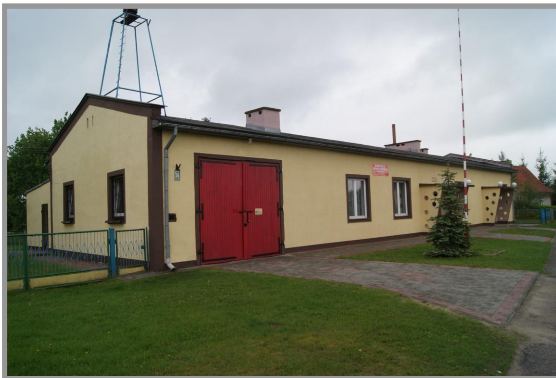
Fot. Budynek Świetlicy Wiejskiej w Reszkach

Obszarem o szczególnym znaczeniu dla zaspokojenia potrzeb społecznych miejscowości Reszki, mając na uwadze przede wszystkim układ przestrzenno-urbanistyczny, a także przeznaczenie obiektów zlokalizowanych w tym rejonie, jest obszar zawarty pomiędzy budynkiem świetlicy a kościołem. Walory i cechy przestrzenno-urbanistyczne przedmiotowego obszaru przemawiają za koniecznością jego rozwoju pod kątem efektywnego kształtowania tej przestrzeni publicznej, wprowadzania działań na rzecz podnoszenia stopnia rozwoju społeczeństwa, zacieśniania więzi i integrację społeczną.