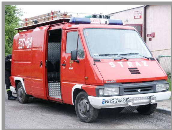
Fot. Samochód OSP Idzbark

Posiada lekki samochód gaśniczy Renault Master w wersji GLBAM 0,4/30/40 wyposażony w podstawowy sprzęt do działań ratowniczo – gaśniczych / 3 motopompy , radiostacja samochodowa, 2 nasobne , 2 aparaty powietrzne, piłę do drewna , zestaw lądowy do likwidacji materiałów ropopochodnych oraz urządzenie „Lukas” do ratownictwa technicznego /.