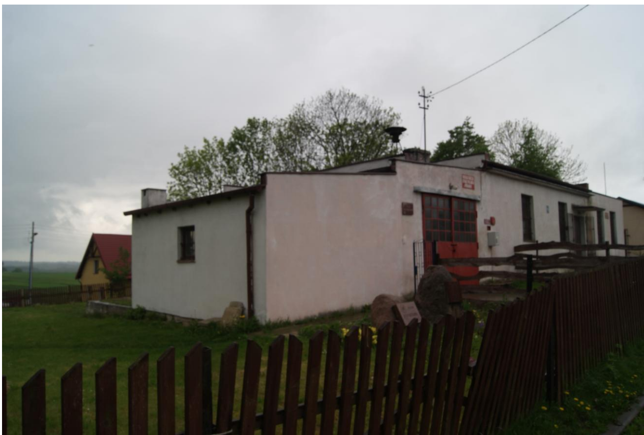
Fot. Budynek Świetlicy Wiejskiej

Obszarem o szczególnym znaczeniu dla zaspokojenia potrzeb społecznych miejscowości Idzbark, mając na uwadze przede wszystkim układ przestrzenno-urbanistyczny, a także przeznaczenie obiektów zlokalizowanych w tym rejonie, jest obszar zawarty pomiędzy Kościołem, świetlicą wiejską i szkołą. Koncentracja praktycznie w jednym miejscu ważnych dla życia społecznego instytucji i obiektów, sprawia że obszar ten pełni funkcję CENTRUM WSI rozumianego jako centrum społeczno-kulturalno-rekreacyjne. Walory i cechy przestrzenno-urbanistyczne przedmiotowego obszaru przemawiają za koniecznością jego rozwoju pod kątem efektywnego kształtowania tej przestrzeni publicznej, wprowadzania działań na rzecz podnoszenia stopnia rozwoju społeczeństwa, zacieśniania więzi i integrację społeczną.