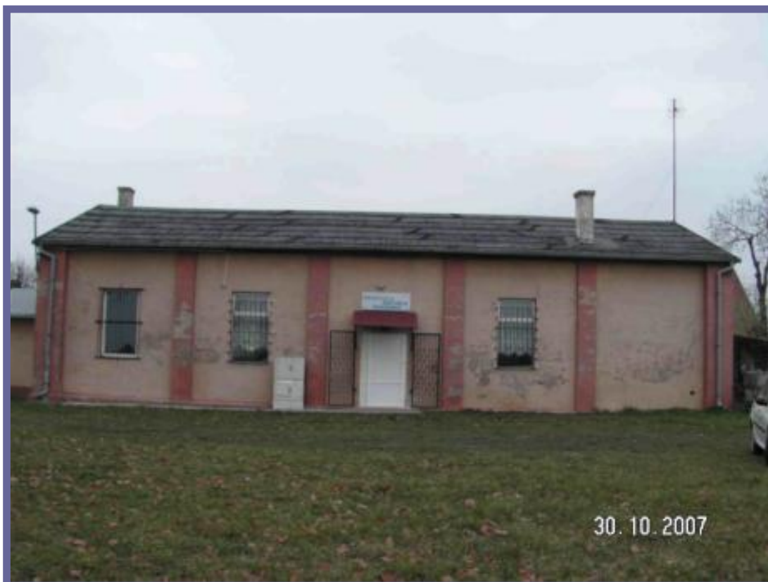
Fot. Siedziba Świetlicy w Ostrowinie

Obszarem o szczególnym znaczeniu dla zaspokojenia potrzeb społecznych miejscowości Ostrowin , mając na uwadze przede wszystkim układ przestrzenno-urbanistyczny, a także przeznaczenie obiektów zlokalizowanych w tym rejonie, jest obszar, na którym znajdują się boisko trawiaste, świetlica wiejska, sklepy spożywczo-przemysłowe. Walory i cechy przestrzenno-urbanistyczne przedmiotowego obszaru przemawiają za koniecznością jego rozwoju pod kątem efektywnego kształtowania tej przestrzeni publicznej, wprowadzania działań na rzecz podnoszenia stopnia rozwoju społeczeństwa, zacieśniania więzi i integrację społeczną.