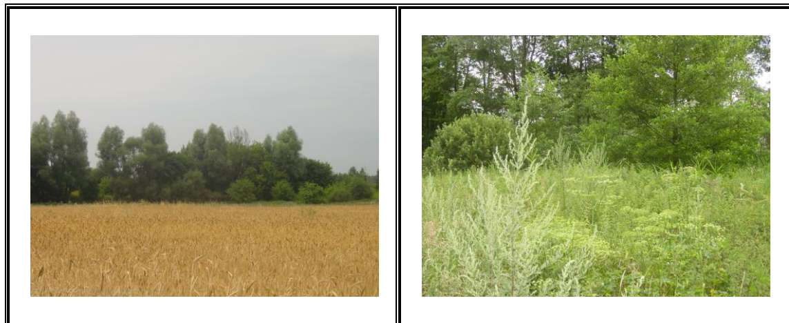
Fot. Lasy olszowe

Działalności gospodarcza na terenie Samborowa spowodowała przeobrażenie rodzimej szaty roślinnej jak również wprowadzenie towarzyszącej uprawom roślinności synantropijnej w postaci chwastów i zbiorowisk roślinności ruderalnej, usytuowanej przy osiedlach ludzkich. Tego typu zespoły roślinne występują w miejscach, gdzie zniszczono dawną szatę florystyczną. Utrzymują się jedynie dłużej na terenach ulegających stałej ingerencji człowieka, jak pola uprawne, zabudowania gospodarcze, nasypy i wykopy linii kolejowej, pastwiska, ogrody, boisko sportowe itp.