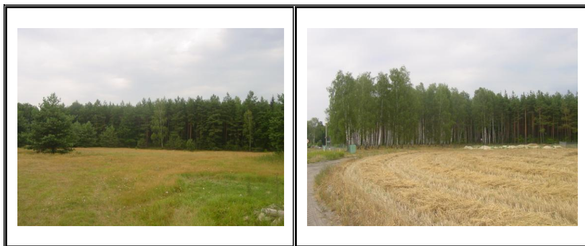
Fot. Lasy przyległe do wsi Samborowo

W dolinie rzeki Drwęcy i jej dopływach na stanowiskach silnie uwilgoconych występują lasy olszowe oraz towarzyszące im zarośla łozowe wkraczające na przybrzeżne łąki bagienne i pas szuwarów.