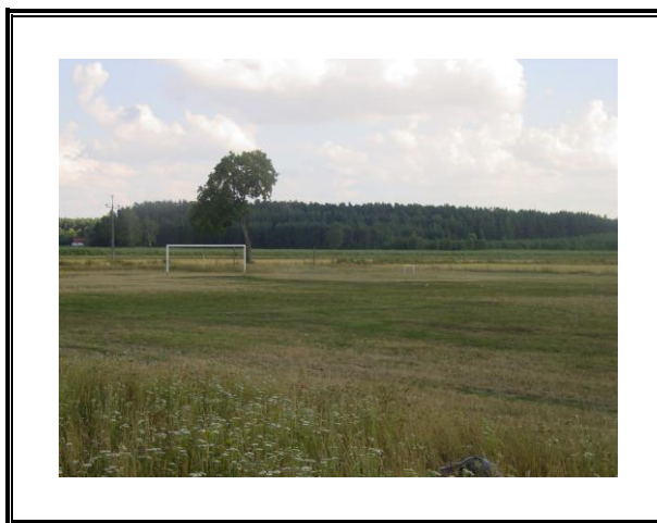
Fot. Boisko Drwęcy Samborowo

Aby spełnić wymogi Okręgowego Związku Piłki Nożnej, który sprawuje pieczę nad klasą rozgrywek, w której uczestniczy Drwęca, niezbędne jest wykonanie ogrodzenia okalającego boisko. Zaniechanie powyższego działania może skutkować wykluczeniem samborowskiego klubu z rozgrywek bądź konieczność rozgrywania spotkań na innych obiektach.