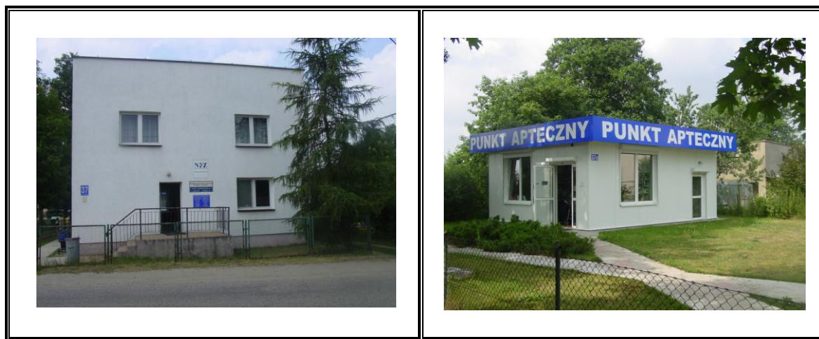
Fot. Ośrodek Zdrowia i Punkt Apteczny w Samborowie

W 2005 roku siedziba WOZ została poddana renowacji (nowa elewacja, ocieplenie, odnowienie schodów). Jednak, aby trud działań remontowych nie został zniweczony na terenie obiektu należy przeprowadzić prace wykończeniowe.