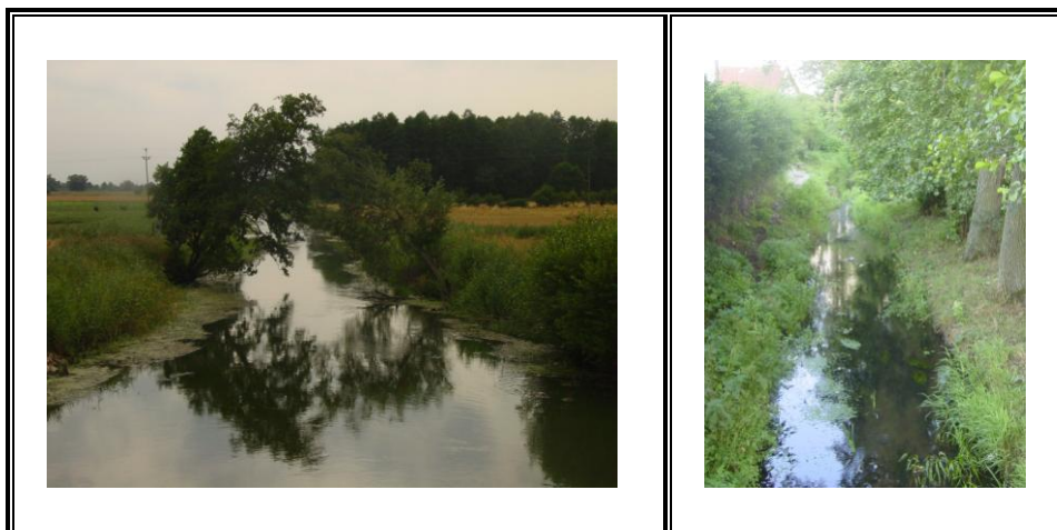
Fot. Rzeka Drwęca (po lewej) Rzeka Poburzanka (po prawej)

łososiowatych. Wyniki badań wody w rzece nie napawają optymizmem, Poburzanka wprowadzają do Drwęcy wody III klasy czystości.