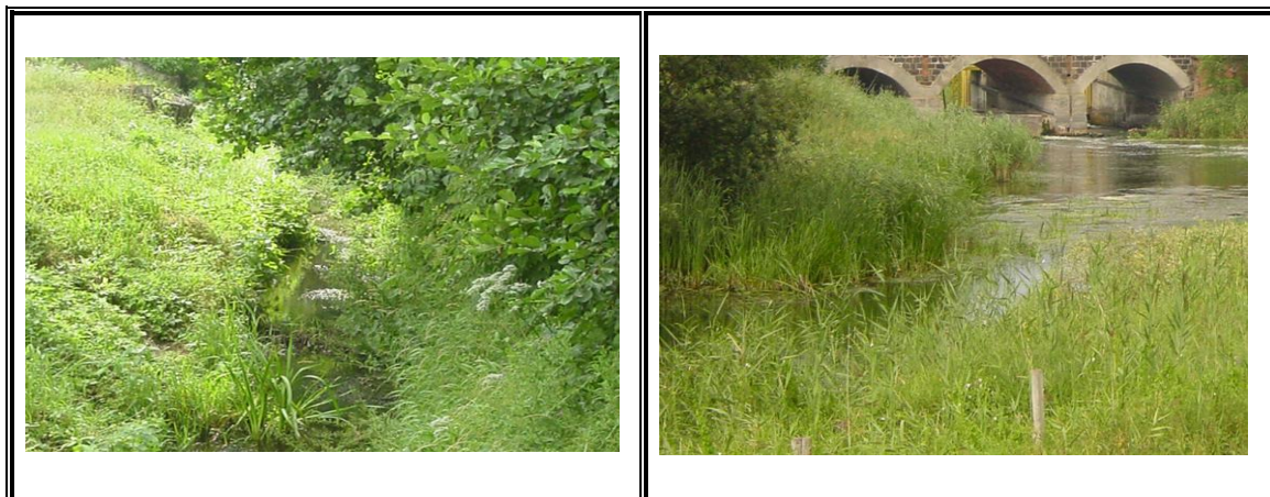
Fot. Zbiorowiska roślinności wodnej

Samborowo otaczają trzy duże kompleksy leśne oraz kilka mniejszych izolowanych skupisk, które należą do leśnictwa Drwęca i Gierłoż. Wyróżnia się lasy: iglaste, mieszane i liściaste o następującym składzie gatunkowym: