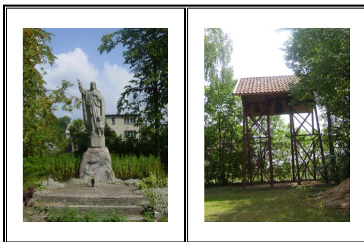
Fot. Figurka i dzwonnica Parafii św. Stanisława Biskupa w Samborowie

W ramach działalności parafialnej organizowane są pielgrzymki do sanktuariów i miejsc kultu. Wraz z Gminnym Ośrodkiem Kultury Kościół św. Stanisława Biskupa w Samborowie organizuje wigilie dla mieszkańców wsi oraz dożynki parafialne.