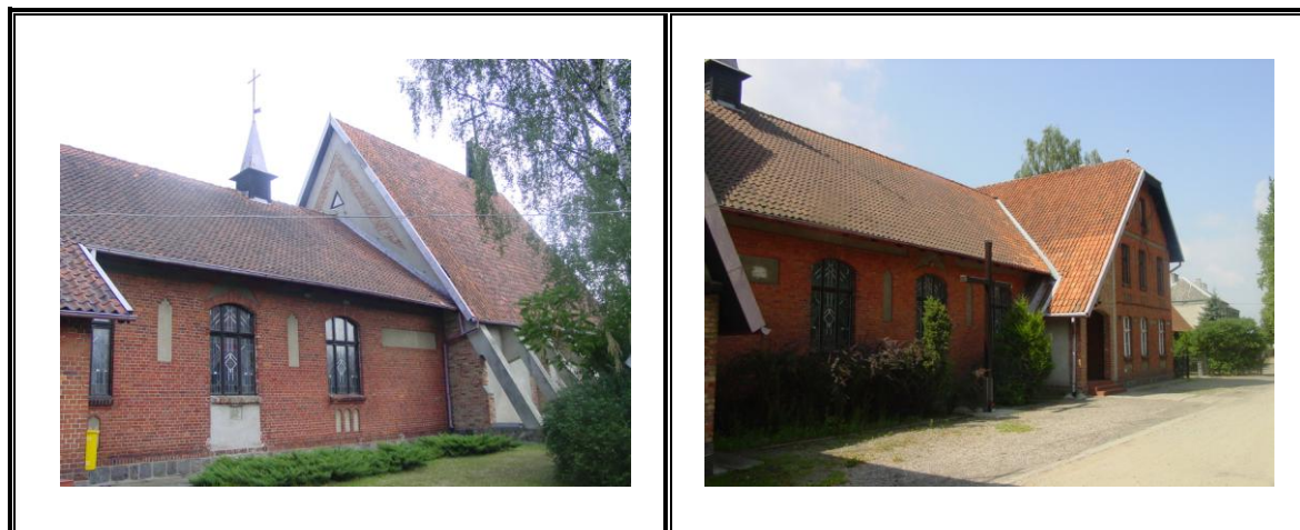
Fot. Kościół i plebania - Parafii św. Stanisława Biskupa w Samborowie