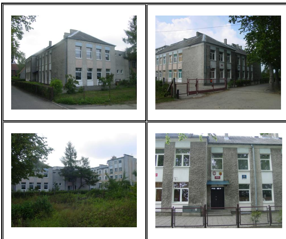
Fot. Zespół budynków szkolnych w Samborowie

Zespół Szkolno-Przedszkolny w Samborowie ulokowany jest w budynkach, na które składają się: sale lekcyjne, pomieszczenia zaplecza technicznego, lokale mieszkalne, hala gimnastyczna. Ostatnia inwestycja na terenie szkoły została poczyniona 2004 roku. W wyniku prowadzonych zadań powstała sala gimnastyczna z zapleczem (szatnie, natryski, pomieszczenia gospodarcze). Nowopowstały obiekt został połączony z już istniejącymi za pomocą dwukondygnacyjnego łącznika. W łączniku znajdują się: gabinety dyrektora, pedagoga, pokój nauczycielski, biblioteka i gabinet lekarski. Ponadto w ramach prowadzonych inwestycji została zmodernizowana istniejąca kotłownia olejowa.