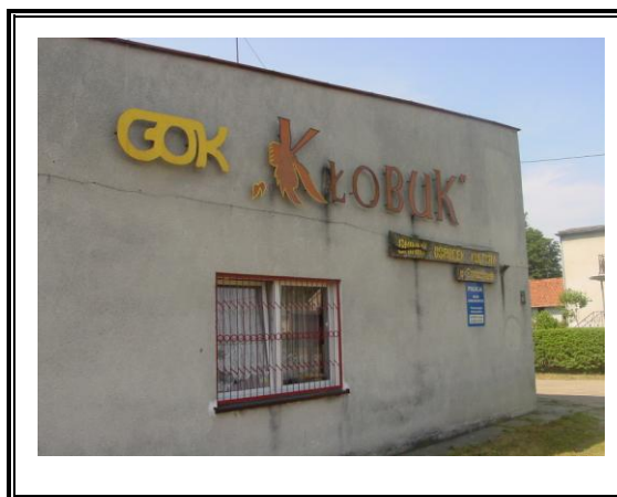
Fot. Siedziba GOK w Samborowie

Zadania z dziedziny kultury na terenie Gminy Ostróda realizowane są poprzez działalność Gminnego Ośrodka Kultury w Samborowie i 14 podległych świetlic wiejskich. Podstawowym celem placówki jest pozyskiwanie i przygotowanie społeczeństwa do aktywnego uczestnictwa w kulturze oraz współtworzenie jej wartości poprzez realizację zadań w dziedzinie wychowania, edukacji i upowszechniania wiedzy i kultury, działalność informacyjna.