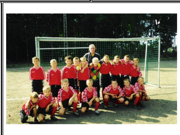
Fot. Drużyny juniorskie Drwęcy Samborowo

W roku 2005 i 2006 poczyniono inwestycje mające na celu podniesienie standardu boiska piłkarskiego. Zakres poczynionych robót obejmował: prace ziemne, wysiew nawozów i trawy, wałowanie.