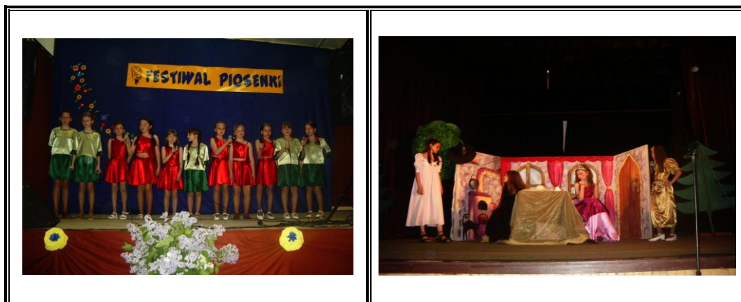
Fot. Występy zespołów i kół młodzieżowych na scenie GOK

Z pomieszczeń GOK Samborowo na co dzień korzystają: