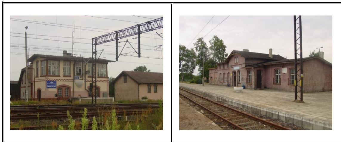
Fot. Stacja PKP w Samborowie

Przez miejscowość prowadzi droga krajowa Nr 16 Olsztyn – Grudziądz, zarządcą drogi jest Generalna Dyrekcja Dróg Krajowych i Autostrad. Droga w momencie przebiegu przez Samborowo zaopatrzona jest w chodnik. Ponadto zainstalowano oświetlenie uliczne (ostatnio dokonana inwestycja – wymiana starych opraw oświetleniowych na energooszczędne).