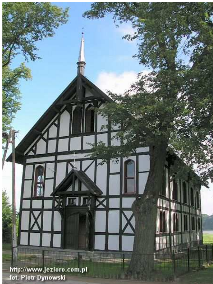
Kościół w Kraplewie

Przy skrzyżowaniu dróg prowadzących z Kraplewa w kierunku na Lichtajny i Brzydowo znajduje się tradycyjna mazurska kapliczka. Mieszkańcy bardzo dbają o jej wygląd. To wizytówka ich zaradności i pracowitości.