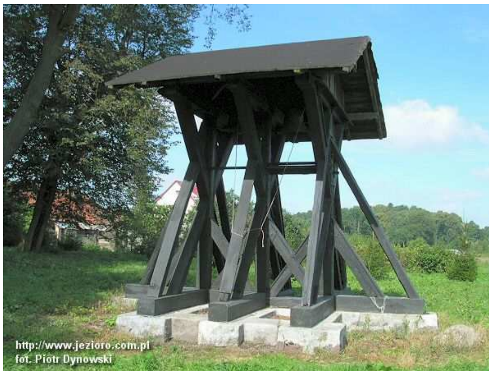
Zabytkowa dzwonnica koło kościoła w Kraplewie

takie uroczystości jak: Dzień Matki Choinka dla dzieci z Kraplewa. Bardzo aktywnie działającą i popularną osobistością Kraplewa jest tutejszy Pastor, który wspólnie z kierownictwem Dworku i Panią Sołtys współorganizuje wszystkie wiejskie uroczystości i spotkania. Bardzo ciekawym spotkaniem była Choinka dla dzieci w grudniu 2004 roku, kiedy to Pastor zaprosił gości specjalnych z dalekich krajów – Azji, Afryki, Australii i Stanów Zjednoczonych. Goście opowiadali dzieciom o swoim życiu i zwyczajach w swoich krajach. Co roku dzieci przygotowują występy – przygotowują się uczniowie z Szkoły Podstawowej w Brzydowie i gimnazjum w Durągu. Te działania podejmowane przez mieszkańców Kraplewa wskazują, że przykładają oni szczególną wagę do wychowania dzieci w atmosferze umożliwiającej im rozwój. Chodzi także o to, by dzieci mieszkające na wsi nie odbiegały zbyt w swoich doświadczeniach od dzieci z miasta.