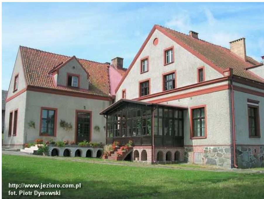
Foto: Klasycystyczny dwór w Kraplewie

Dwór w obecnym kształcie datowany jest na rok 1919 po zaistniałej wówczas przebudowie. Porównanie map niemieckich z 1875 r. oraz z 1914 r. ze stanem obecnym umożliwia konstatację zmian w obrębie całego zespołu podworskiego. Obejmuje on dwór, park i folwark – łącznie 8,45 ha. Park (2,10 ha) datowany jest na przełom XIX-XX wieku, podobnie jak większość zabudowań folwarcznych, zachowała się stajnia z 1815 r.