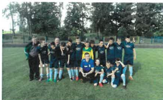
Źródło: Gminny Klub Sportowy „Iskra” Smykówko